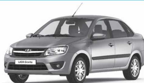
LADA GRANTA Стоимость 323 910 руб.

Первоначальный взнос 102 000 руб. Ежемесячный платёж всего 9 050 руб.