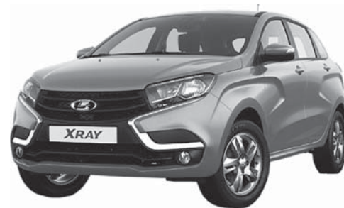
LADA XRAY Стоимость 508 410 руб.

Первоначальный взнос 102 000 руб. Ежемесячный платёж всего 9 050 руб.