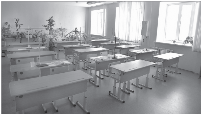
Глава города остался доволен результатами обновления материально-технической базы школы.