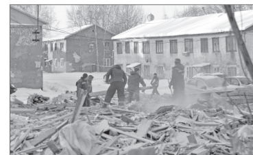
Ветхие дома исчезают «с лица» Нижневартовска.