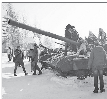
Списанная и выставленная на базе отдыха «Ольгино» военная техника пользуется у вартовчан популярностью. С предложением организовать аналогичный музей под открытым небом на Комсомольском бульваре горожане обратились на «горячую линию».

- Да, действительно, на сегодняшний день администрация города разрабатывает тарифы для льготной категории граждан на посещение базы отдыха «Радуга», - отметила Надежда Волчанина. - Стоимость отдыха для пенсионеров и ветеранов войны обещает быть значительно ниже, чем, скажем, для рядовых горожан. В самое ближайшее время все условия льготного тарифа будут документально оформлены, и мы доведём их до сведения руководителей общественных организаций.