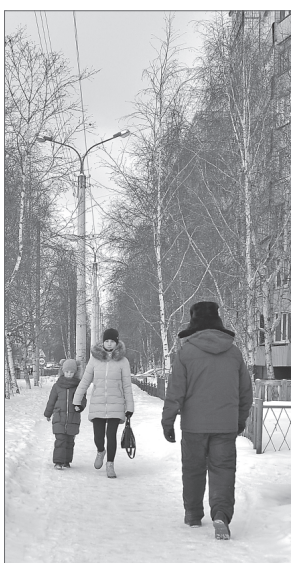
«Скользкая тема»: песок на тротуарах - грязь или залог безопасности?