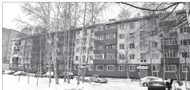
Лидия Уфимцева.