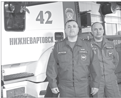
Вот они - герои нашего времени.

Конечно, все мы с детства помним, что в жизни всегда есть место и время для подвига... Только, где нас поджидает это место, - никому не ведомо. А время порой играет с нашим сознанием весьма причудливо. Вот и история этого, прямо скажем, героического поступка уложилась фактически в пять минут, но стоила шести спасённых жизней, две из которых - детские. А начался подвиг двоих огнеборцев из пожарно-спасательной части под номером 42 в 23.00 17 июля этого года, когда на центральный пункт 5 отряда ФПС поступил тревожный звонок: «Горит жилая квартира по адресу: Нефтяников, 78-а».