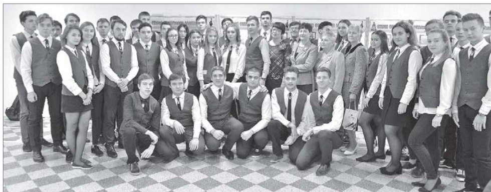
Встреча нефтяников прошлого и будущего.

Ветераны АО «Самотлорнефтегаз», дочернего предприятия НК «Роснефть», пришли в гости к ученикам нижневартовских «Роснефть-классов». Встреча прошла под эгидой завершающегося Года экологии.