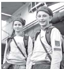
Главная цель движения «Юнармия» - вызвать интерес у подрастающего поколения к географии, истории России и ее народов, героев, выдающихся ученых и полководцев.

Одним из новых направлений работы на 2018 год члены Координационного совета по молодёжной политике при администрации Нижневартовска считают создание на базе общеобразовательных учреждений города отрядов юнармейцев. Появление нового общественного движения - инициатива министра обороны России Сергея Шойгу. Основной задачей стало объединение всех организаций, занимающихся допризывной подготовкой граждан, в единую команду. Сегодня деятельность «Юнармии» получила поддержку президента страны Владимира Путина, а само движение набирает обороты во всех уголках нашей необъятной Родины. В том числе и в Нижневартовске. Уже 350 вартовчан могут похвастаться тем, что носят гордое звание юнармейца.