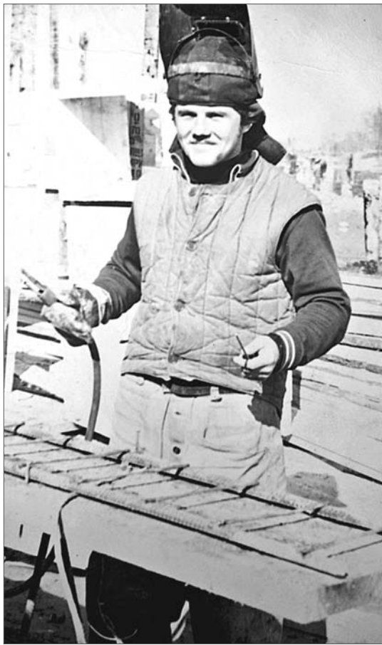
Электрогазосварщики с юности стремятся добиться каллиграфического совершенства. Только при этом полотно – металлоконструкция, и не то что ошибок, даже помарок быть не должно.

«Что тут скажешь? Задор юности во мне всё ещё жил, наружу рвался избыток сил и энергии. И билет был куплен, – рассказывает он. – 1978 год. Нижневартовск. Словами не передать, в какую атмосферу масштабных работ и комсомольского энтузиазма я окунулся. Чтобы понять, надо это самому пережить».