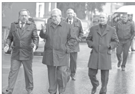
В рабочей поездке комитета по дорожному хозяйству.

- Много наказов избирателей по старой части города выполнено за последнее время?