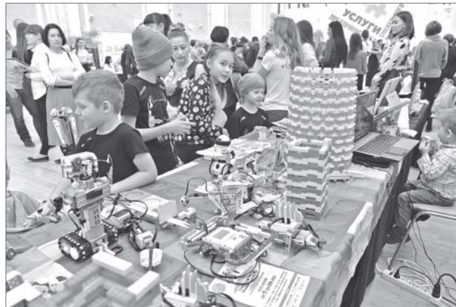
Настоящее столпотворение устроили мальчишки возле стенда робототехники.

Третья городская выставка «Услуги социального предпринимательства» проходила весело, шумно и многолюдно. Она оказалась востребованной не только среди самих предпринимателей, но и среди горожан. Первым было интересно себя показать, а посетителям было любопытно посмотреть, что им предлагают. Судя по участникам выставки, в сфере социального бизнеса сегодня наиболее актуальны проекты, направленные на раннее интеллектуальное развитие и дошкольное образование, оздоровительный спорт, декоративное искусство и прикладное творчество. Настоящее столпотворение устроили мальчишки возле стенда робототехники. А школа «Майкрафт» предлагала альтернативу родителям, которые отчаялись отвлечь своих отпрысков от гаджетов. Под занавес свои успехи продемонстрировали те, кто пользуется услугами социального бизнеса. Ребята играли на необычных