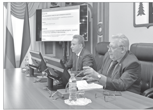
На заседании комитета по городскому хозяйству и строительству.

И щу себе преемника, который бы продолжил моё дело. Мне не всё равно, кто придёт после меня в старую часть города и займётся работой с избирателями. В планах создать деятельный территориальный общественный совет, который охватит территорию и будет заниматься не говорильней, а практическим решением вопросов.