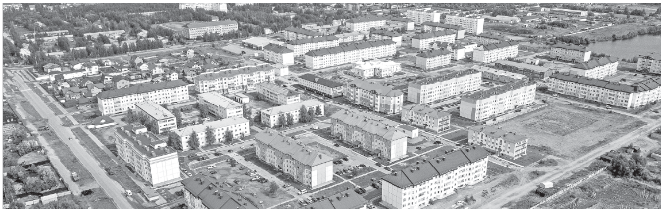
Новые кварталы старой части города.

- Какое из направлений депутатской работы вы считаете основным и почему?