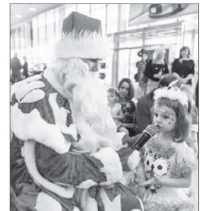
Подготовила Гуля Бессонова.

Планировать детские утренники тоже лучше заранее. Дворец искусств подготовил новогоднюю игровую программу для малышей от двух до пяти лет «Сладкий Новый год». Представления состоятся 28, 29, 30 декабря, а также 2, 3, 4 января в 10.00, 12.00, 13.30. В программе игры с Дедом Морозом, Снегурочкой, сладкими сказочными персонажами, фотосессия. Представление состоится в паркетном зале. Билет по цене 350 рублей можно приобрести в кассе Дворца искусств с 10.00 до 14.00 и с 15.00 до 19.00 ежедневно. Принимаются коллективные заявки.