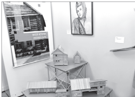
Экспозиция музея истории русского быта.