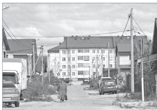
Улица Рабочая - часть уютного Нижневартовска.

Я бы так не сказал, работа мне не в тягость, хоть и достался Старый Вартовск. Депутатскую деятельность, к примеру, в старой части города нельзя сравнить с работой в городских микрорайонах. И хоть сегодня мой участок немного сократился, но 17-я школа, посёлки Магистральный, Тепличный, улицы Повха, Анисимковой, Льва Толстого, посёлки на 2П, 10П, 14П - это всё моя территория.