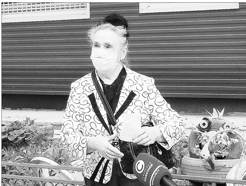
Если жители неравнодушны, то двор становится уютным.