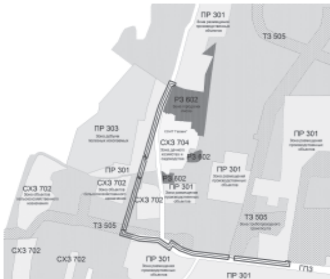
Схема границ проектируемой территории для размещения линейного объекта газопровода в части Северо-западного узла города Нижневартовска