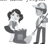
Дарья Ткаченко.

Отметим, что всего в первый день уборки было собрано около 400 мешков мусора , почти столько же и во второй день.