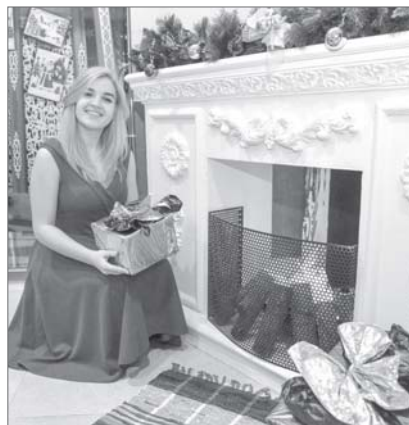
Несмотря на мороз, это был очень теплый вечер.