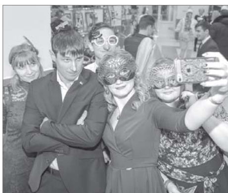
Селфи с миссис Икс.

Приглашённые не только весело, но и с пользой провели время. Были организованы различные мастер-классы, конкурсы и лотереи. Молодым людям предлагалось сделать новогоднюю игрушку, придумать дизайн открытки, украсить пряник и даже научиться рисовать на воде в технике эбру. Также праздничную атмосферу создавали живая музыка и сказочные герои в исполнении артистов дворца культуры.