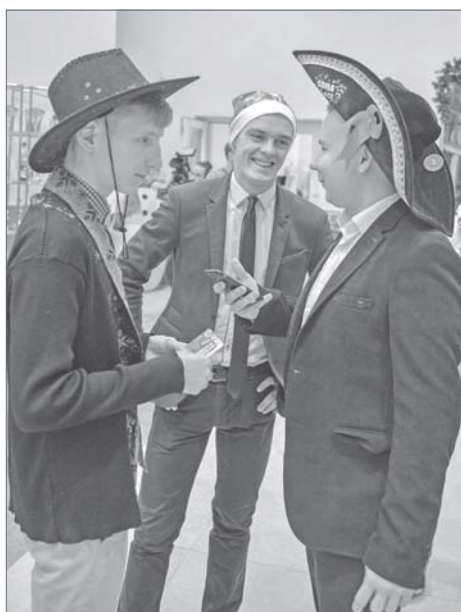
А помнишь, мы в детстве всегда наряжались ковбоями?