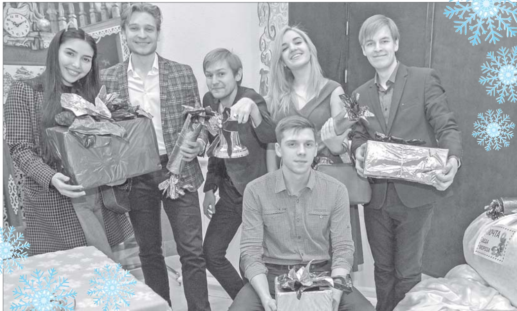
Время дарить внимание друг другу.

В этот вечер всё преобразилось, девушки в великолепных нарядах смогли почувствовать себя элегантными леди, а молодые люди - настоящими джентльменами. Новогодний молодёжный бал, организованный управлением по социальной и молодёжной политике администрации города и Молодёжным парламентом при Думе Нижневартовска собрал во Дворце культуры «Октябрь» 150 вартовчан в возрасте от 16 до 30 лет.