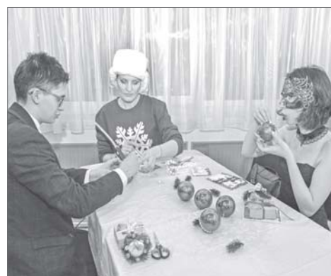
Хенд-мейд всегда в моде.

На протяжении нескольких часов гости общались между собой за чашкой чая. Для них также было оформлено несколько фотозон. Одна из них под названием «Улица зеркальная». Здесь можно было сделать селфи и тут же его распечатать. А ещё участники бала написали письма Деду Морозу, в которых попросили исполнить их самые заветные желания. В завершение бала волшебный старец вручил всем приглашённым небольшие сувениры на память.