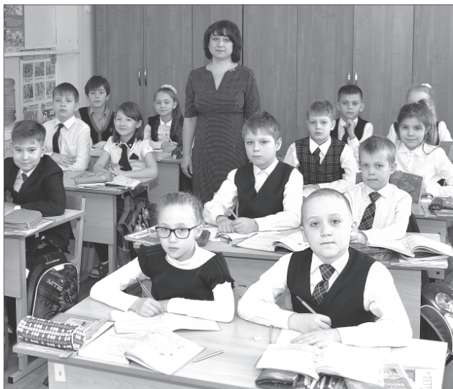
На уроке в средней школе №23.