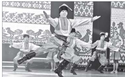
Артисты Дворца искусств смогли зарядить ветеранов нашего города позитивом и хорошим настроением!