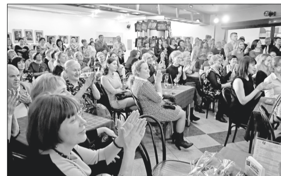
Любой праздник драмтеатра начинается с фойе.

Всем известно, что современная пьеса хорошо представлена на сцене нижевартовской драмы югорскими авторами – Еленой Ерпылевой и Алексеем Житковским, и главный режиссёр Маргарита Зайчикова продолжит эту практику – включать в афишу современную драматургию. Возобновит также начатые в прошлом сезоне репетиции спектакля по пьесе молодого уральского драматурга Ярославы Пулинович «Свой