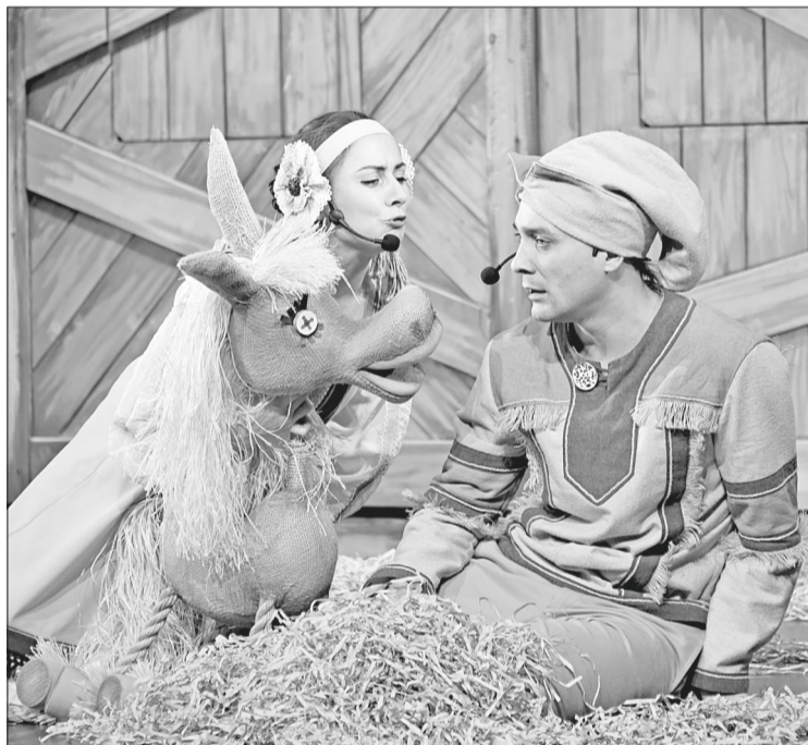
Сцена из спектакля ТЮЗа «Конёк-Горбунок».

Нынешний сезон был у театров коротким. Из-за коронавируса пришлось срочно переходить в онлайн-пространство и не только репетировать, что называется, на дому, но и думать о зрителях, чтобы и они не скучали по театру и продолжали чувствовать, что сейчас как никогда нужны актёрам. Страницы драмтеатра и театра юного зрителя в социальных сетях были заполнены под завязку видео: чтение, записи спектаклей. Конечно, такая связь со зрителями не заменяла живого дыхания зала, когда во время спектакля он замирал или взрывался смехом как единый организм. Впрочем, тепло на расстоянии артисты ощущали. На комментарии к видеороликам зрители тоже не скупились.