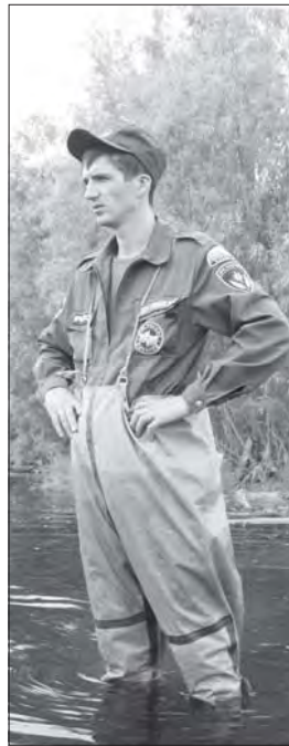
Казалось бы, воды - по колено, но на самом деле сотрудник МЧС стоит на одной из вспомогательных дамб, которая должна была защищать автобусную остановку.