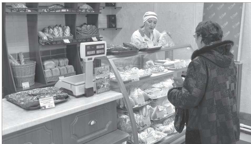
На сегодняшний день в городе есть ряд магазинов, на прилавках которых можно найти продукцию сразу нескольких местных брендов. Если они займут свое место и на полках федеральных сетевых магазинов, прежде всего от этого выиграют потребители, которые предъявляют высокие требования к составу продуктов, предпочитают качественные товары местного производства.

срок хранения. Например, хлебобулочные изделия. Руководители сети готовы рассматривать коммерческие предложения от потенциальных партнеров. Главное условие - предложенные товары должны быть сертифицированными, иметь индивидуальную упаковку и штрих-код. Срок рассмотрения предложений - 30-45 дней.