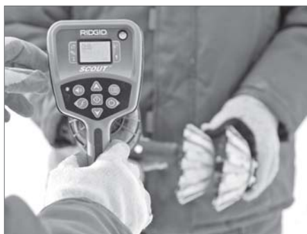
Твердые отложения в трубах благодаря очистке новым методом удаляются в полном объеме.

Общая протяжённость трубопроводов на Самотлорском месторождении составляет порядка тысяч километров. Их содержанием занимаются специалисты трёх цехов эксплуатации и ремонта трубопроводов - ЦЭРТ, а также лаборатории неразрушающего контроля АО «Самотлорнефтегаз» - дочернего предприятия ПАО «НК «Роснефть». Специалисты следят за состоянием всей системы, обеспечивают безопасную работу и нацеливают свою деятельность на раннее выявление дефектов.