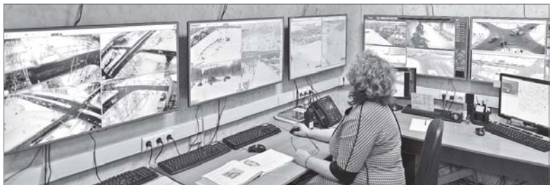
Город как на ладони.

Всего в 2017 году зафиксировано более 200 тысяч вызовов.