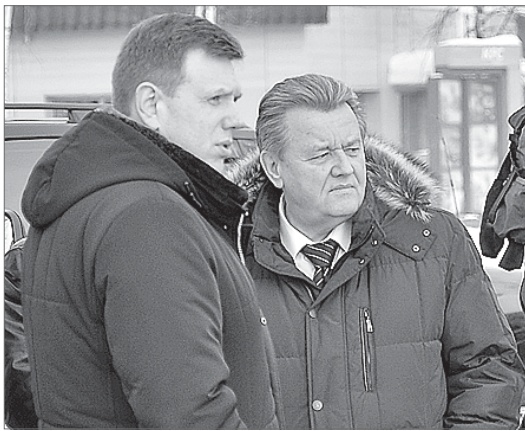
Безопасность вартовчан - в приоритете у городской власти.