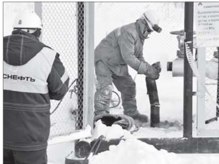
В АО «Самотлорнефтегаз» ведется непрерывная работа по изысканию, оценке и внедрению новых технологий, повышающих надежность трубопроводов.

Общая протяжённость трубопроводов на Самотлорском месторождении составляет порядка тысяч километров. Их содержанием занимаются специалисты трёх цехов эксплуатации и ремонта трубопроводов - ЦЭРТ, а также лаборатории неразрушающего контроля АО «Самотлорнефтегаз» - дочернего предприятия ПАО «НК «Роснефть». Специалисты следят за состоянием всей системы, обеспечивают безопасную работу и нацеливают свою деятельность на раннее выявление дефектов.