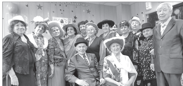
Они и теперь такие же озорные, как 30 лет назад.