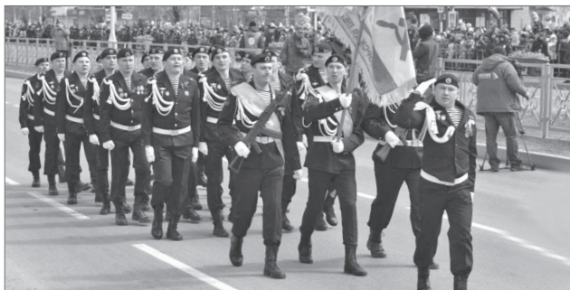
Морские пехотинцы всегда в строю.

На юбилейном параде в честь 70-летия Победы советского народа в Великой Отечественной войне парадный расчёт морских пехотинцев маршировал впервые. На парней в чёрных беретах тогда обратили внимание многие горожане - было в них что-то особенное. Проходя мимо трибун, они по-военному твёрдо чеканили шаг, словно отдавали честь и ветеранам, и тем, кто не вернулся с войны. Второй год в городе действует общественная организация «Союз морских пехотинцев Нижневартовска».