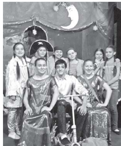
Зимняя сказка с теплом ребячьих сердец.

Не все дети могут водить хороводы вокруг новогодней ёлки. Эту ситуацию решили исправить участники театральной студии средней школы №31. Специально для детей с ограниченными возможностями здоровья они подготовили и сыграли спектакль «Новогоднее путешествие».