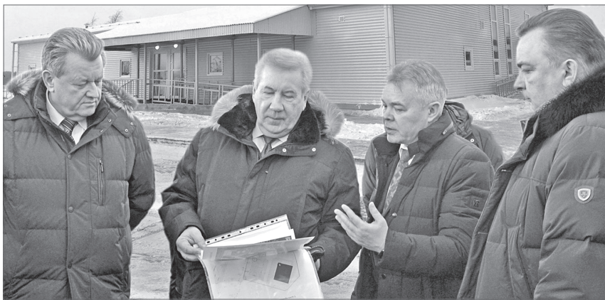
В «Модуле» созданы все условия для занятий разными видами адаптивного спорта.

То, что медицинский диагноз не приговор, а один из стимулов заниматься спортом, нижевартовские спортсмены доказали не только себе, но и всему миру.