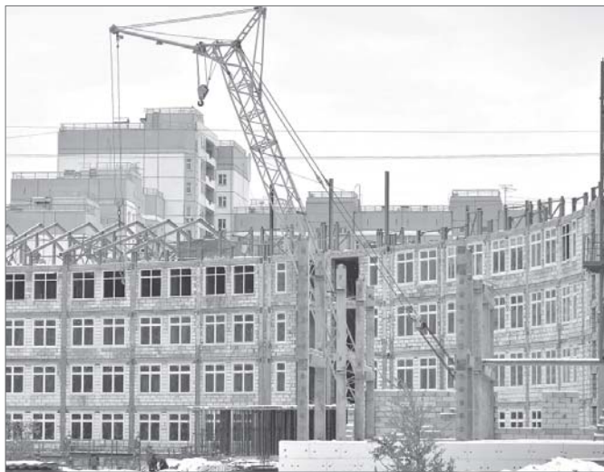
Школа рассчитана на 1750 учеников и строится в два этапа.

«Роснефть» в уходящем году традиционно оказывала финансовую поддержку в рамках соглашения о социальном партнёрстве. Нефтяники выполняют взятые на себя обязательства в различных социальных сферах, в том числе в системе образования. Без средств, которые направляет компания «Роснефть» на развитие социальной сферы в нашем городе, невозможно было бы реализовать в полной мере многие проекты в системе образования. Это строительство школ и детских садов, обновление зданий образовательных учреждений, оснащение детских дошкольных учреждений, приобретение оборудования для игровых прогулочных площадок и т.д.