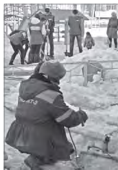
Специалист ЖЭУ, в соответствии с картой нарушений, отрезает торчащую из-под снега арматуру.

Безразмерные лужи во дворах - ещё одна головная боль, причём не только коммунальщиков, но и жителей абсолютно всех микрорайонов. Гигантские сугробы, отсутствие ливневой канализации - верный знак того, что проблем с приходом весны не избежать. Чтобы лужи таких объёмов не доставляли неудобства горожанам, работники управляющих компаний должны своевременно принимать меры по отведению талой воды. Акцент на этом в своей презентации и сделали волонтеры школы №14. Ребята не просто определили проблему, отметили местоположение лужи на карте, но и добились участия спе-