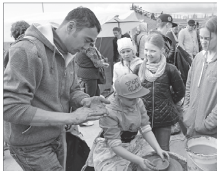
Мастер-класс по гончарному делу.