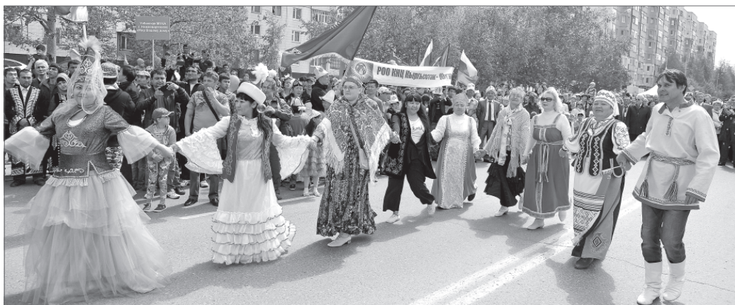
Хоровод дружбы народов.