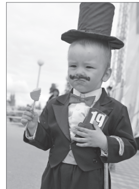
Конкурс на лучшую шляпу.