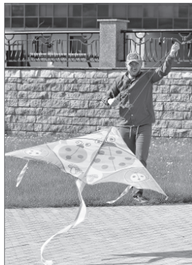
Шоу воздушных змеев.