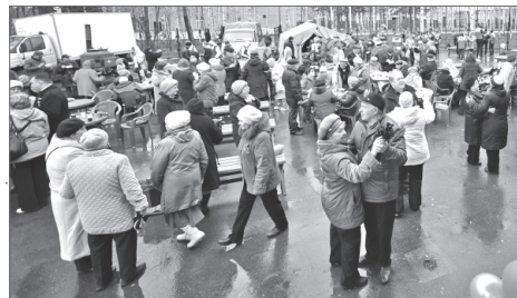
Управление по потребительскому рынку администрации Нижневартовска.