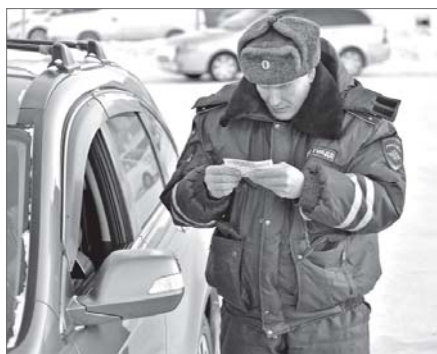
Достоверение об инвалидности проверят обязательно.

Важно знать, что правом ставить автомобиль на месте «Парковка для инвалидов» обладают далеко не все, а только люди с I и II группами инвалидности.