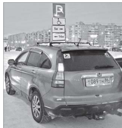
У спорткомплекса «Олимпия» всегда есть свободные парковочные места для инвалидов.