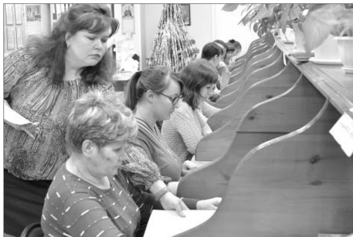
Теоретический этап: 20 самых важных вопросов о профессии.

Такие творческие испытания, отмечают организаторы, дают сотрудникам стимул - стремиться выше, идти в своих знаниях дальше, повышать разряд, заслуженно добиваться роста заработной платы. Церемония награждения победителей пройдёт в аккурат ко Дню энергетика. Денежный приз и почётная грамота - станут наградами для тех, кто занял второе и третье места. Лучший сотрудник года получит 10-процентную прибавку к зарплате в течение всего 2019 года.