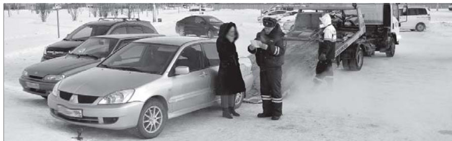
На площади перед ж/д вокзалом регулярно эвакуируют автомобили.