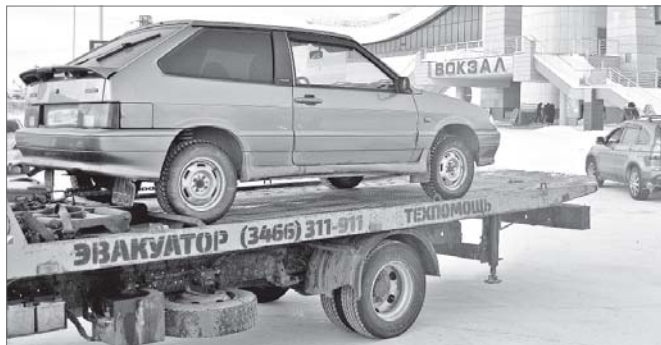
Чтобы не разыскивать свой автомобиль, паркуйтесь правильно.

Большой автомобильный поток, стремление занять место поближе к дому, отсутствие достаточного числа парковочных мест - не является оправданием для человека, который, не задумываясь, пусть и на время ставит своё транспортное средство в специально отведённом для инвалидов месте. Закон всегда на стороне правды, а то, кто его попирает, должен быть готов к тому, что однажды, выйдя на улицу, просто не найдёт свой автомобиль на парковке. Сотрудники Госавтоинспекции, заручившись поддержкой администрации города и общественников, вышли в совместный рейд. Давить на совесть не стали, а вот несколько протоколов составили и штрафы выписали.