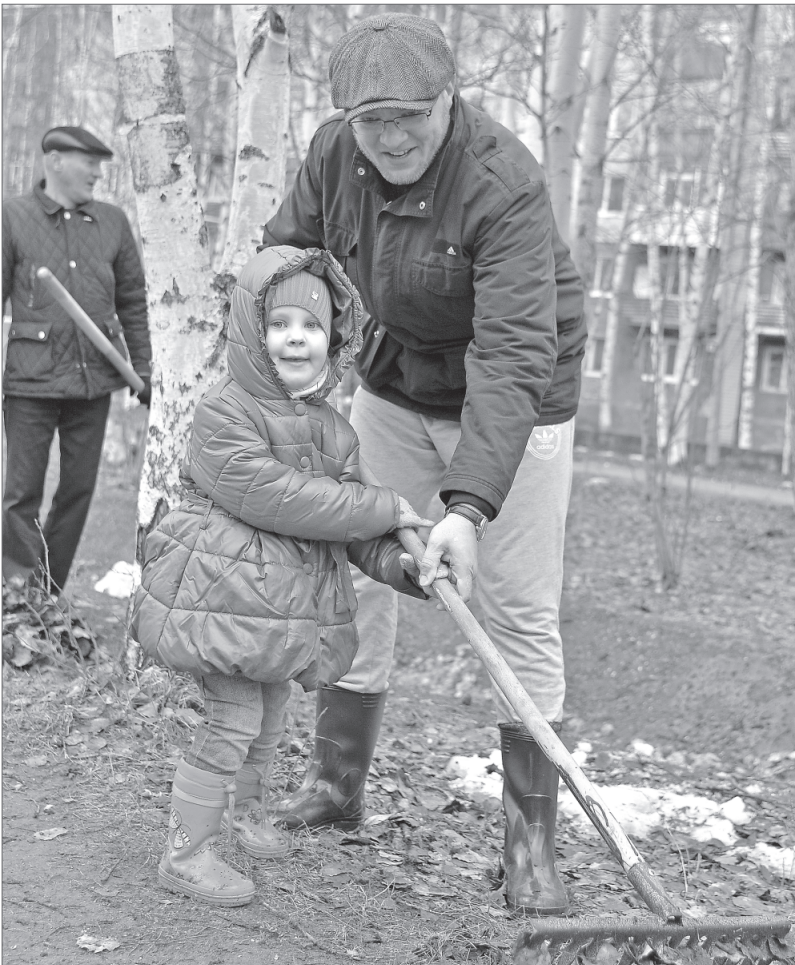
В традиционных субботниках участие принимают и стар, и млад.