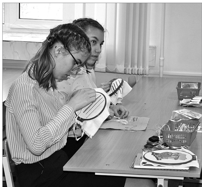
Вышивание учит терпению.

В кабинете технологии для девочек оборудована кухня, где можно изготовить любой кулинарный шедевр, на рабочих столах – швейные машинки. Здесь вяжут, шьют, вышивают, плетут, изучают дизайн. Очевидно, что выпускники школы №13 унесут с уроков не только академические знания, но и владение разными ремёслами.