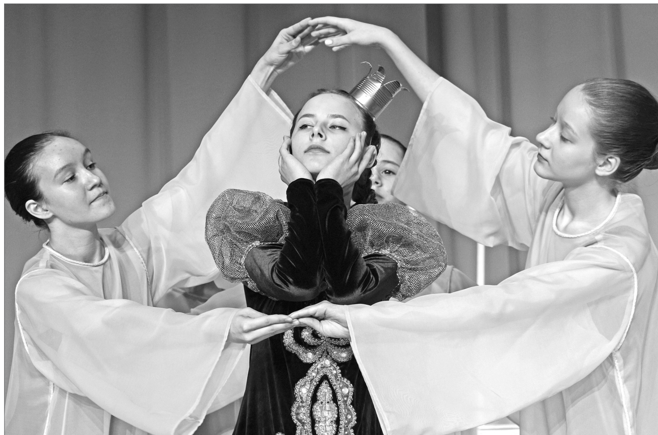
Прекрасная принцесса, влюблённый Трубадур, характерные разбойники и верные дружбе и своему делу бродячие артисты. В ДШИ №1 поставили на сцене «Бременских музыкантов». На премьере зал был полон.

З атёртая до дыр книга, заезженная до заикания виниловая пластинка, выученные наизусть диалоги главных героев и неповторимые песни в исполнении Олега Анофриева, Муслима Магомаева – такими запомнились бродячие артисты нескольким поколениям россиян. Трудно поверить, что созданный ещё при Советском Союзе мюзикл в этом году отмечает своё пятидесятилетие. Солидный возраст вместе с тем не сказывается на его популярности. Яркое тому подтверждение – полный зал зрителей, среди которых в равных соотношениях были как нынешняя детвора, так и их родители. Первые аккорды – и зал взрывается аплодисментами. Живой звук, волнение в рядах исполнителей главных ролей, интересные задумки в создании костюмов и декораций. Старая, старая сказка оживает на глазах, а серьёзные на вид мамы и папы на время спектакля точно возвращаются в детство. Любимые песни пели хором, юных талантов долго не отпускали со сцены, вызывая на бис, детвора и взрослые не отказывали себе в удовольствии сфотографироваться на память с главными героями вечера. Стоит отметить, что впервые перенести рисованных персонажей на сценические подмостки воспитанники ДШИ №1 решились в 2012 году. В этот раз музыкальная фантазия «Бременские музыканты» получила новое прочтение. Успеху этой постановки у вартовчан смогли бы позавидовать даже титулованные артисты.