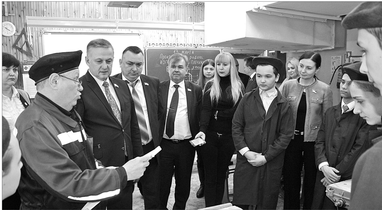
Ремесло в руках высшему образованию не помеха.