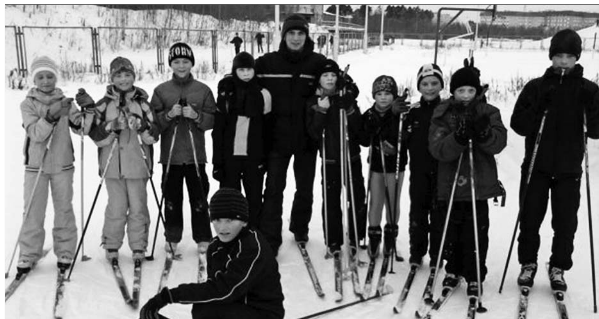
Годы, проведённые в секции биатлона стали временем дружбы.