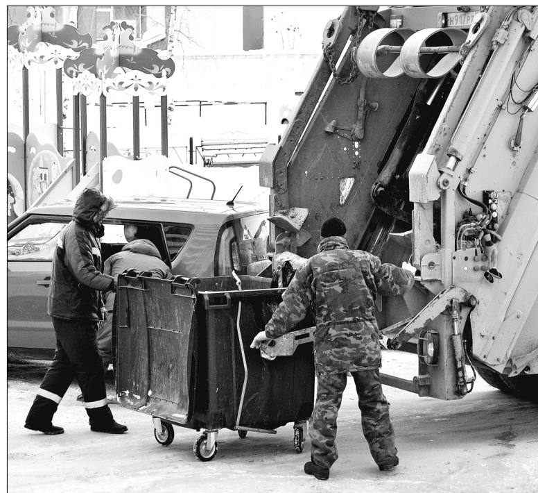
Раздельный сбор мусора - ещё один шаг к улучшению экологии.

Специалисты считают, что новый механизм обращения с ТКО позволит вывести «мусорные потоки» из тени, правильно организовать их размещение, обезвреживание и утилизацию. В перспективе нескольких лет предстоит избавиться от стихийных свалок в пригородных лесах, поймах рек и оврагах. Теперь станет невыгодно занижать объёмы отходов и часть вывозить на несанкционированные «мусорки», так как данный объём отходов уже оплачен по установленному тарифу региональному оператору.