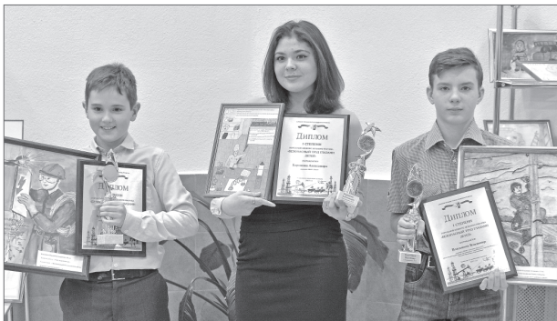
Победители первого городского конкурса рисунков «Безопасность труда глазами детей».

С детской непосредственностью, но о главном. В Нижневартовске подвели итоги первого городского конкурса рисунка «Безопасность труда глазами детей». Выпускники детских садов и школьники всех возрастов яркими красками разрисовали рабочие будни, убедив родителей, что в жизни нет ничего дороже здоровья, для сохранения которого важно и нужно соблюдать правила безопасности условий труда.