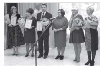
Награждение сотрудников «Отрады».

Четверть века назад в Нижневартовске появился Дом-интернат «Отрада» для престарелых и инвалидов. Коллективу пришлось пройти сложный путь развития, особенно на первых порах, ведь тогда опыта подобной работы ни у кого не было. Но благодаря энергии сотрудников, их оптимизму и преданности профессии «Отрада» стала ведущим социальным учреждением Югры. В эти дни коллектив торжественно отметил 25-летний юбилей.