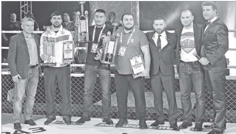
Триумфаторами турнира стали сургутяне. На втором месте - Нефтеюганск, на третьем - Московская область.

Подарком от Федерации MMA Югры, от окружного департамента физической культуры и спорта всем любителям смешанных единоборств стало общение с почётными гостями - чемпионом мира по MMA Анатолием Малыхиным, а также шестикратным чемпионом мира, пятикратным чемпионом Европы по тайскому боксу, капитаном сборной России Артёмом Левиным.