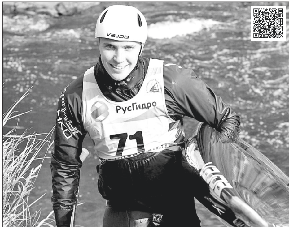
Недавно наш земляк принял участие в первенстве России, которое состоялось в Окуловке Новгородской области.

– В период самоизоляции находилась в Нижевартовске в кругу семьи. У меня был подготовлен план, которого я придерживался. Первое время тренировался дома – делал упражнения на координацию, растяжку, занимался на гребном тренажёре, в общем, старался сохранить физическую форму.