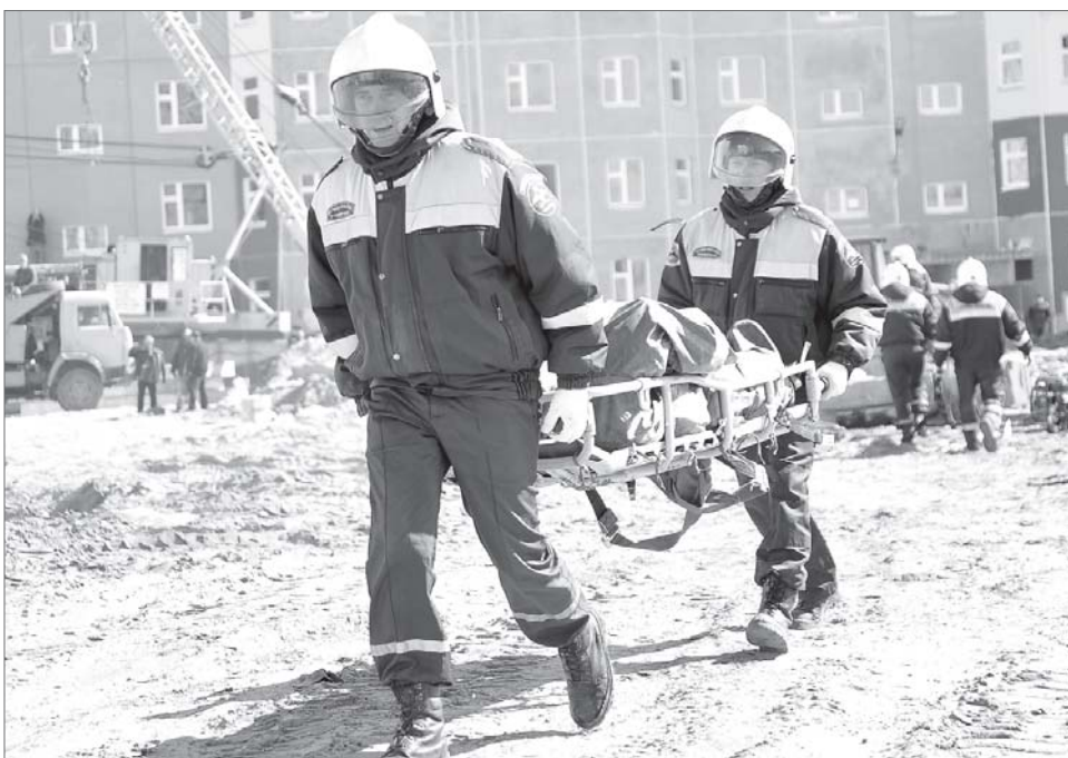
Свои навыки спасатели постоянно отрабатывают на учениях.

Уважаемые сотрудники и ветераны спасательных служб города Нижневартовска! От всей души поздравляем вас с профессиональным праздником! Ваш труд - это синоним мужества и героизма, несгибаемой воли и большой доброты. Вы первыми направляетесь туда, где людям нужна помощь. Оперативно и чётко действуете в самых трудных ситуациях, доказывая своё высокое мастерство. Вы посвятили жизнь великой миссии - спасению людей. Ежедневно соприкасаясь с чужой бедой, вы не черствеете душой. Спасибо за самоотверженный труд и любовь к профессии. Дорогие друзья! Мы желаем вам и вашим близким счастья, благополучия и успехов! Побольше тихих семейных вечеров и поменьше опасных выездов! Пусть наступающий год как можно реже испытывает вас на прочность!