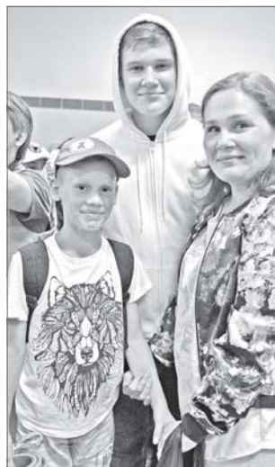
Только за первую смену на базе учреждений образования, культуры, спорта, социального обслуживания в 65 лагерях всех типов смогли отдохнуть порядка 5 000 ребят.