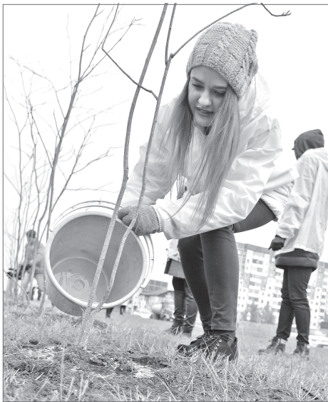
Чтобы молодые саженцы надежно закрепились на новом месте, их обильно полили.

Работы по озеленению территории муниципальных образований - это лишь малая часть экологической политики такой крупной нефтегазодобывающей структуры, как группа предприятий «Варьганнефтегаз» НК «Роснефть».