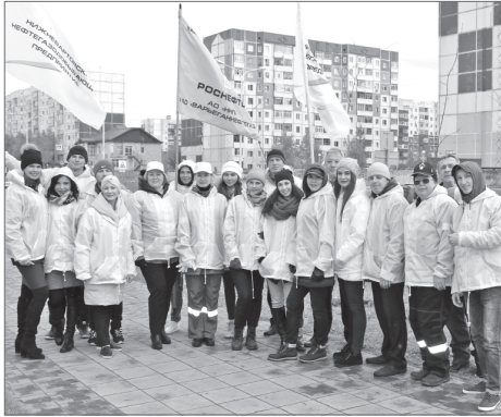
В высадке рябин приняли участие как нефтяники со стажем, так и молодые специалисты группы предприятий «Варьганнефтегаз».

Работы по озеленению территории муниципальных образований - это лишь малая часть экологической политики такой крупной нефтегазодобывающей структуры, как группа предприятий «Варьганнефтегаз» НК «Роснефть».