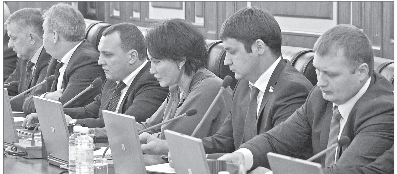
Каникулы у депутатов были чисто символическими. Представительный орган власти не прекращал свою работу ни на один день.