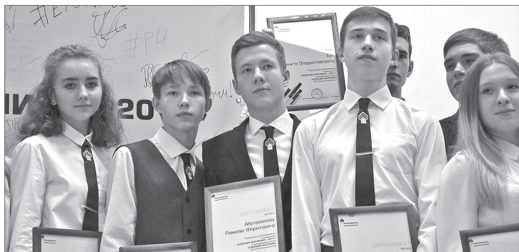
А вот и свидетельства компании «Роснефть» о том, что ее намерения в отношении будущего этих молодых людей и серьёзны, и ответственны.

Виктор Малеев. Фото из архива АО «Самотлорнефтегаз».