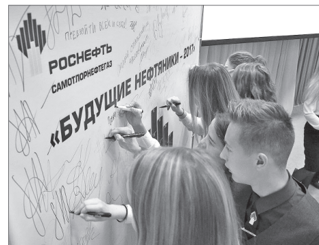
Слова словами, но и расписаться в том, что все здесь по-взрослому, согласились все.