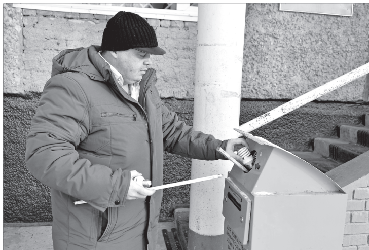
Все больше вартовчан сдают ртутьсодержащие отходы на переработку.

Согласно постановлению администрации города от 24.06.2015 №1184 «Об утверждении Порядка организации сбора отработанных ртутьсодержащих ламп на территории города Нижневартовска» физические лица, собственники жилых домов должны сдавать ртутьсодержащие отходы в специально оборудованные места. Юридические лица и индивидуальные предприниматели обязаны заключать договоры со специализированными организациями, осуществляющими сбор и обезвреживание таких отходов.