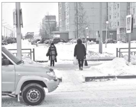
У железнодорожного вокзала еще один переход станет регулируемым.

Во время выездного заседания комитета по вопросам безопасности населения Думы города депутаты сделали остановку рядом с перекрёстком улиц Серафимовой и Чапаева.