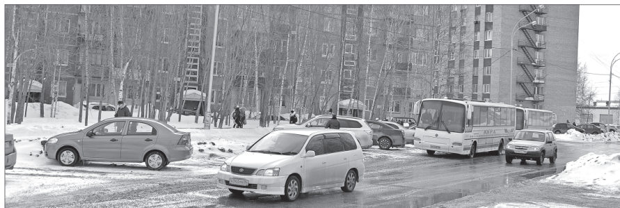
У дома 4-а на улице Омской будут установлены сборно-разборные искусственные дорожные неровности.