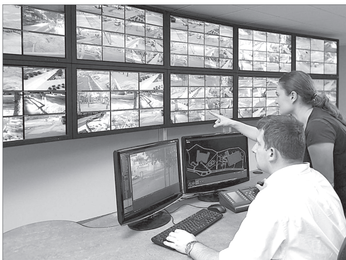
Все объекты социальной сферы города оборудуются системами видеонаблюдения, оповещения и освещения, остальные инженерно-технические средства устанавливаются в соответствии с присвоенной каждому объекту категорией опасности.

«Варта» рассказывает о видах работ, которые обеспечивают нашу с вами безопасность при посещении социальных объектов нашего города.