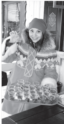
Волонтеры встречают гостей улыбками и полезным лакомством - ягодами клюквы.