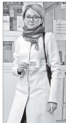
«Фестиваль» театр начнет 29 октября.