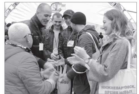
Упражнение «Десять рукопожатий» - лучший способ для знакомства.

Вовлечённость участников форума в процесс обсуждения наиболее важных вопросов натолкнула губернатора на мысль, что встречаться нужно гораздо чаще. Наталья Комарова предложила всем собравшимся подумать над дальнейшими формами общения и созданием площадки для оперативного решения вопросов бизнеса.