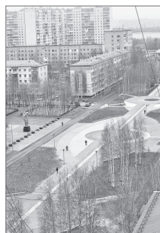
Комсомольский бульвар после реконструкции.