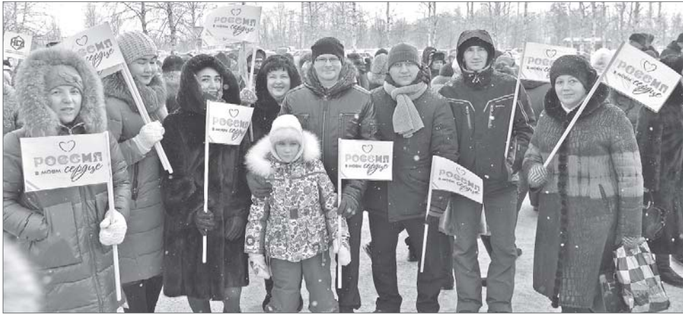
Всего в патриотической акции приняло участие более полумиллиона россиян.