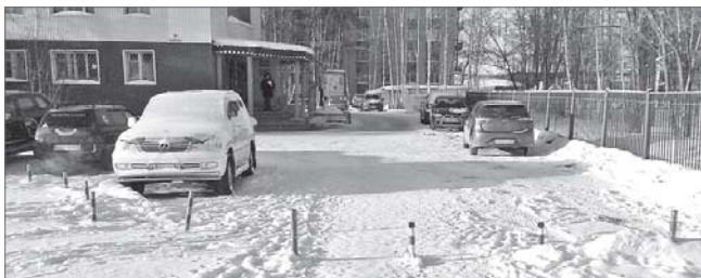
Отныне горожане вокруг Школьной аллеи свои автомобили паркуют по правилам.

Осенью завершилось строительство Школьной аллеи. Но уже через пару месяцев к депутатам поступило обращение горожан, обеспокоенных сохранностью новой зоны отдыха.