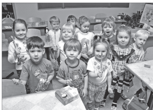
У наших детей - хорошее будущее.