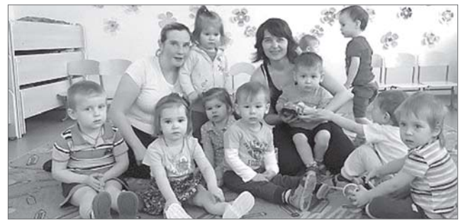
Приоритет в 2019 году - семейные ценности.

Координация усилий, доверие и партнёрство - основные источники и движущая сила ожидаемого обществом развития.