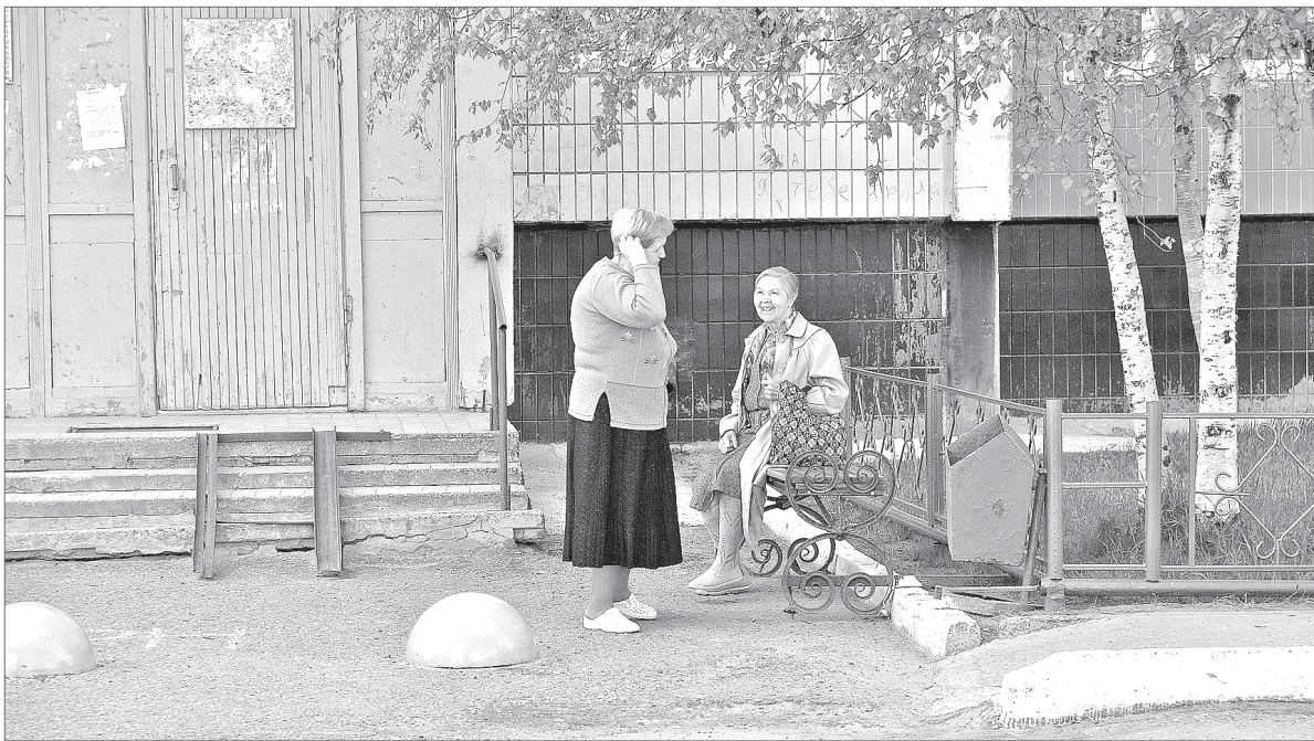
Уютно в домах 6 микрорайона.

В МУП «ПРЭТ № 3», занимающемся комплексным обслуживанием микрорайонов, находящихся в управлении этой организации, в разгаре подготовка к предстоящему зимнему сезону. Напомним, что к управляющей компании ПРЭТ №3 относятся жилой фонд 3-го, 6-го и 10-б микрорайонов, а также все деревянные застройки. Предприятие обслуживает 339 многоквартирных домов.