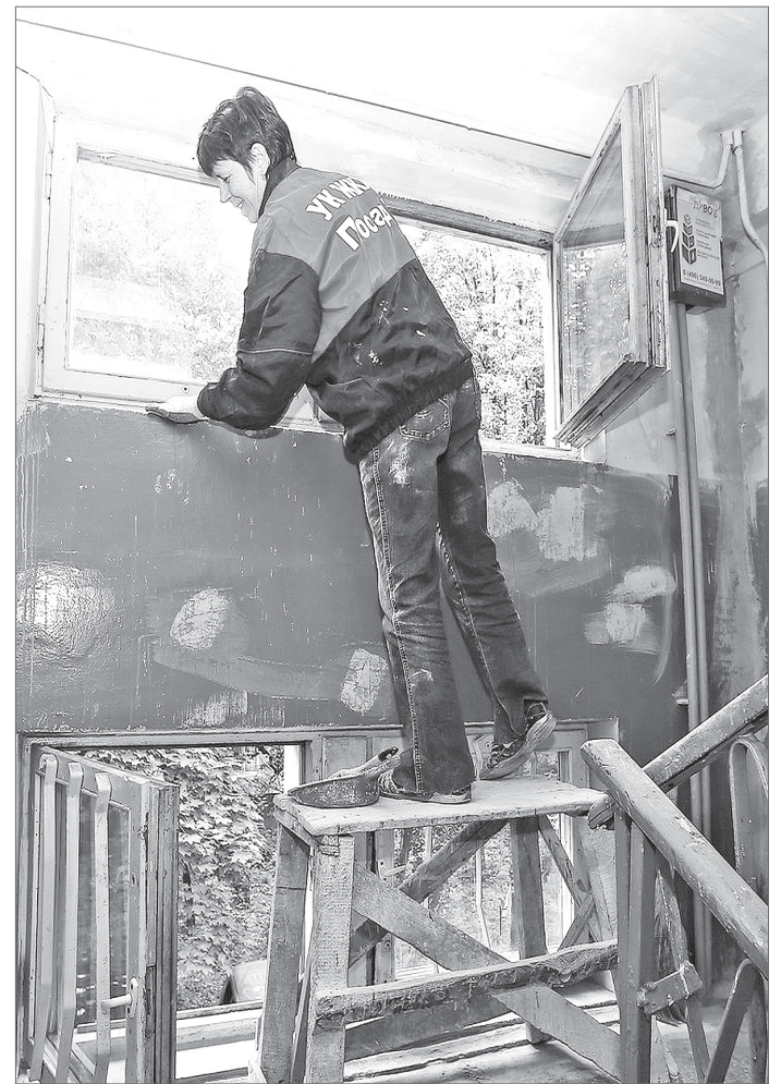
В подъезде станет красиво.

Запланировано провести ремонт и замену входных тамбурных дверей 27 многоквартирных домов в разных микрорайонах ПРЭТ № 3. Электромонтажные работы будут проводиться в 304 домах. Намечен довольно большой объём сантехнических работ. В 328 домах проведут ремонт при подготовке систем отопления к запуску тепла. Будут обновлены износившиеся участки сетей водоснабжения.