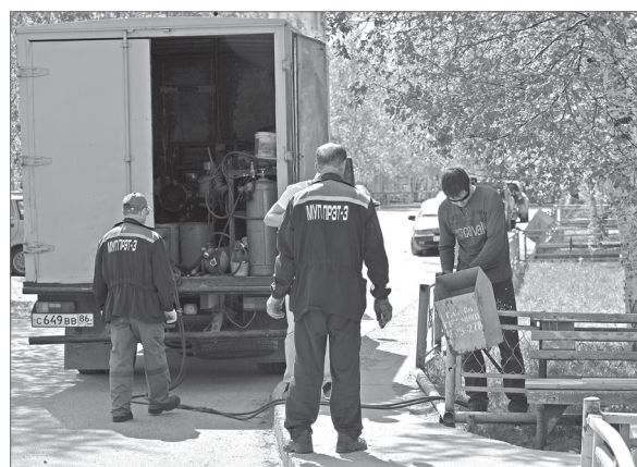
Горячая пора ремонта.

Немало хлопот при подготовке к отопительному сезону, по словам руководителя МУП «ПРЭТ № 3», доставляет гидропневматическая промывка систем отопления, которая проводится сантехниками в течение летнего сезона в отдельных многоквартирных домах. Этот процесс служит для того, чтобы обеспечить качественный обогрев жилых домов в течение зимнего сезона. В абсолютном большинстве домов старой постройки стояки и подводки отопления представляют собой металлические трубы, внутри которых постепенно скапливаются плотные загрязнения и наросты из шлама и ржавчины. От этого уменьшается проходимость труб, появляются залежи в радиаторах отопления. Такие проблемы устраняются способом гидропневматической промывки. Эта работа проводится периодически в каждом жилом доме один раз в три-четыре года по графику. Гидропромывка осуществляется с помощью воздушного компрессора, который под давлением воздуха закачивает в системы поток воды, отчего при циркуляции разбиваются плотные отложения на внутренних стенках труб отопления. Процесс промывки труб отопления в отдельном доме довольно трудоёмкий и занимает целый день. Работа не заканчивается до тех пор, пока вода, закачиваемая в системы, не окажется чистой. При проведении этих мероприятий обязательно присутствуют специалисты МУП «Теплоснабжение».