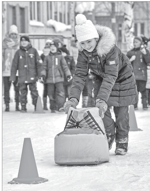
Веселье и смех на площадке у школы №31.