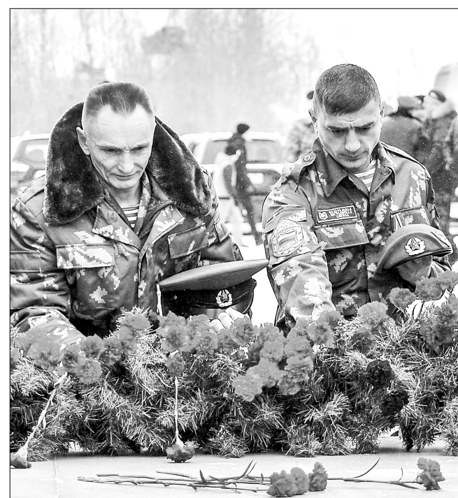
Возложение цветов к мемориалу.

Прозвучал троекратный оружейный залп, и горожане в память о даманцах возложили к подножию мемориала цветы. Среди них были не только ветераны-военнослужащие разных родов войск, но и матери, родные и близкие служащих в погранвойсках. Даманцы – пример мужества, героизма нынешним защитникам Отечества. Будем помнить о них всегда.