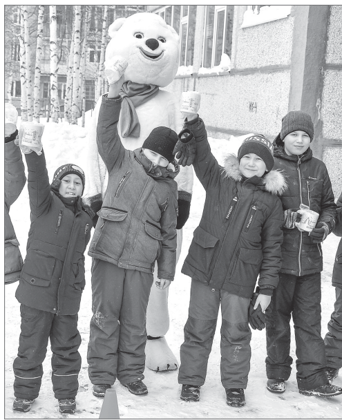
Ни один участник не ушёл без подарка.