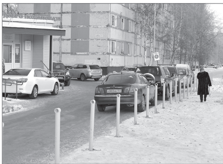
Протокольное поручение выполнено: ограждение на Космопольском бульваре установлено.

Второй светофор установили напротив КДЦ «Самотлор» на улице Маршала Жукова. Пешеходный переход там был всегда, его лишь немного сдвинули в сторону от автобусной остановки. Здесь пешеходам, чтобы перейти улицу, нужно нажать кнопку. Депутаты убедились в том, что неудобств здесь нет. С наступлением тепла подрядчик уложит на дорожки асфальт, установит ограждения и приведёт в порядок зелёную зону. Начальник управления по дорожному хозяйству администрации города Геннадий Котляров отметил, что в прошлом году на этом переходе произошло четыре ДТП с участием пешеходов, и теперь очаг аварийности ликвидирован.