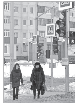
Пешеходный переход на улице Интернациональной.