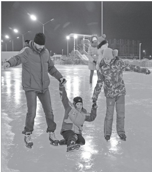
Там, где острие конька касается льда, рождаются искры. Мороз отходит на второй план, а город зажигает огни своего праздничного убранства. Хотите увидеть его во всей красе? Мы не только расскажем, но и на фотографиях покажем, как преобразился любимый Нижневартовск.

Здесь глянцевоый лёд расписан разноцветными искрами, над площадью играет приятная музыка и отовсюду слышен детский смех. В городе, где зима длится больше полугод, ещё одним местом отдыха стало больше. Жители восточных микрорайонов Нижневартовска уже оценили преимущества нового катка и всё свободное время проводят на свежем воздухе.