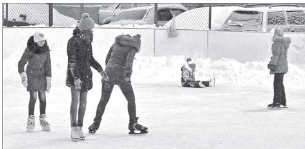
Каток в третьем микрорайоне любит детвора.

Депутаты нижевартовской Думы из комитета по социальным вопросам отправились на инспекцию городских катков.