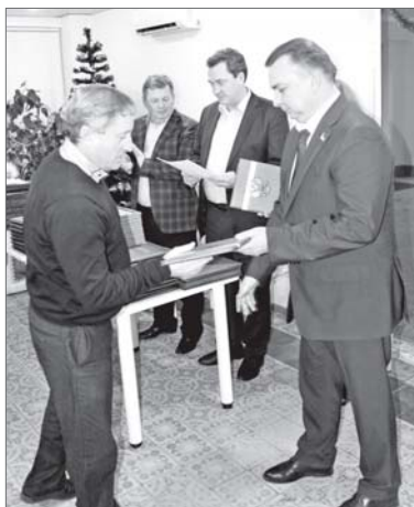
Максим Клец поздравил энергетиков с профессиональным праздником и вручил награды.

«Энергетика - это локомотив экономики, а электрические сети - артерии, по которым в наши дома приходят тепло и свет», - с такими словами обратился к работникам группы компаний предприятия «Горэлектросеть» председатель Думы Максим Клец.