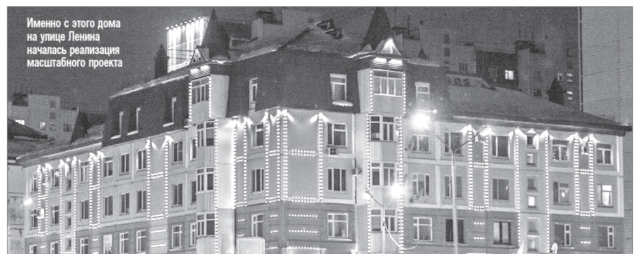
Именно с этого дома на улице Ленина началась реализация масштабного проекта

Планируется контурная подсветка зданий. И наши «хантыйские» орнаменты на домах, и проеортеры. Те, которые могут на стену проецировать изображение: новогоднюю ёлку, например, или что-то другое. Они будут снабжены видеокамерами, включёнными в систему «Безопасный город».