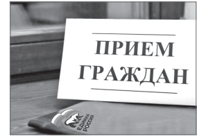
График приёма граждан в местной общественной приёмной ВПП «Единая Россия» Нижневартовска на сентябрь 2017 года.