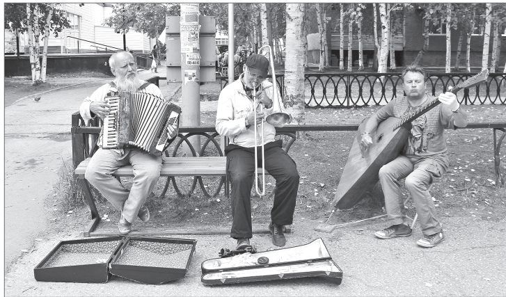
Во так они и музицировали этим летом. Их импровизированной сценой стал тротуар на проспекте Победы, а слушателями - сотни прохожих...

Уличных музыкантов в Нижневартовске увидишь нечасто. То ли климат у нас слишком непредсказуемый для людей искусства, то ли просто традиция как-то не сложилась. Именно поэтому было вдвойне приятно наблюдать целый ансамбль, который день за днём выступал на проспекте Победы в тёплые дни августа. Они садились на лавочке и играли мелодии из мультфильмов и советских кинофильмов, а иногда классику или песни советских лет.