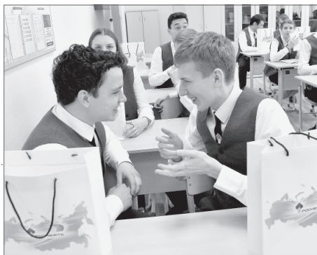
Нижневартовские «роснефтята» получили приятные и полезные подарки от «Самотлорнефтегаза», которые помогут им в процессе обучения.

«Роснефть-класс» не зря называют первой ступенькой к успешной карьере. Сюда приходят те, кто серьёзно решил готовить себя к профессии нефтяника со школьной скамьи. В первый день нового учебного года представители нефтяной компании говорили об этом со своими будущими коллегами.