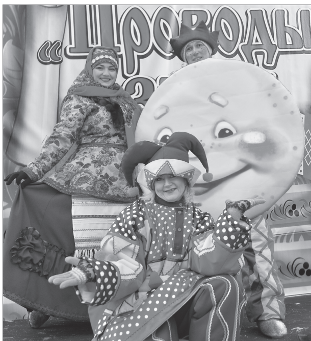
Праздничное настроение создавали творческие коллективы Дворца искусств, скоморохи на ходулях и ростовые куклы. Веселая программа мероприятий пришлась по душе каждому: гости и в футбол в валенках играли, и хороводы водили, и принимали активное участие в различных народных играх. Многоликий Нижневартовск создал настоящую палитру праздничных красок.