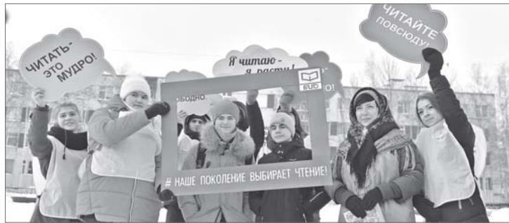
Читать модно всегда и везде. Вартовчане прошли библиоэкзамен, прогуливаясь по Комсомольскому бульвару.

Вооружившись каверзными вопросами, взяв в руки микрофон и видеокамеру, специалисты МУ «БИС» и городской библиотеки вышли в народ.