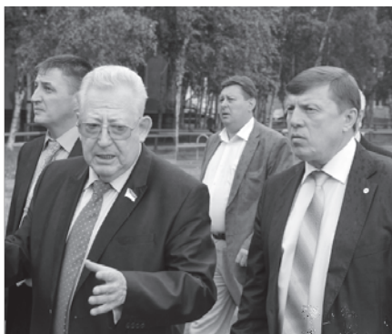
Нижневартовские жилищники проводят экскурсию для гостей.

В городской администрации на днях собрались «за круглым столом» представители общественных советов по вопросам ЖКХ разных городов Югры: Нижневартовска, Урая, Когалыма и Нягани. Они обсудили наиболее актуальные темы жилищно-коммунального хозяйства и обменялись опытом работы, направленной на контроль и улучшение качества обслуживания жилья.