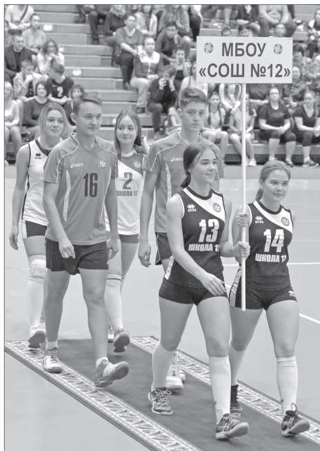
Более 500 школьников сыграют в пятом сезоне ШВЛ.

Спортивный зал Международных встреч гудел, зрительские трибуны взрывались бурными овациями. Юбилейный пятый сезон чемпионата «Школьной волейбольной лиги» официально объявлен открытым. На торжественной церемонии присутствовали представители 58 команд, их тренеры и самые преданные болельщики.