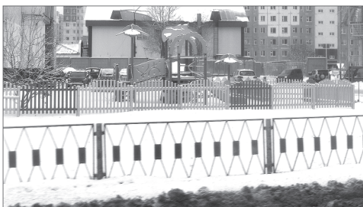
Детская площадка на улице Северной расположена слишком близко к проезжей части, считает один из горожан, позвонивших на «горячую линию».