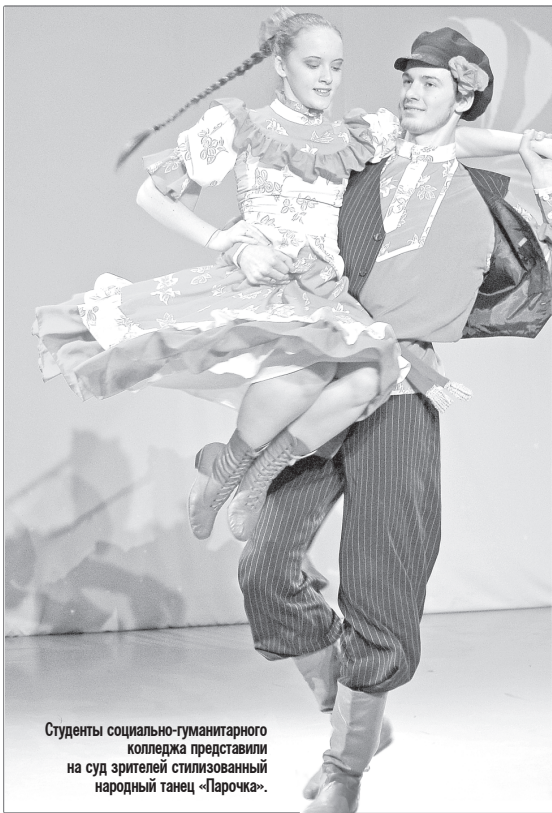
Студенты социально-гуманитарного колледжа представили на суд зрителей стилизованный народный танец «Парочка».

Там, где русская балалайка даёт бой модным музыкальным направлениям, а самобытность - одно из средств самовыражения, берёт начало I Городской арт-фестиваль, для которого культура и традиции - высшая ценность.