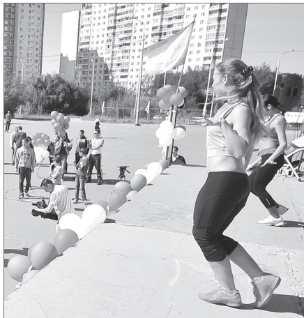
Шумно и весело. Тренировки на свежем воздухе бьют все рекорды популярности

Глава города ставит задачу сделать спорт общедоступным, и энтузиасты общественных организаций численно расширяют аудиторию желающих заниматься спортом. Так, в течение года среди женщин всех возрастов снижали популярность бесплатные тренировки по кроссфиту, всё чаще на открытых площадках массового пребывания горожан проводят занятия по фитнесу. Любовь к турникам и физическим упражнениям привлекают молодёжи добровольцы, занимающиеся Workout. Этим летом на укрепление здоровья работали 26 спортивных площадок, в числе которых роллердром, многофункциональные комплексы с искусственным травяным покрытием, гимнастические сооружения и даже детский игровой парк на Комсомольском озере.