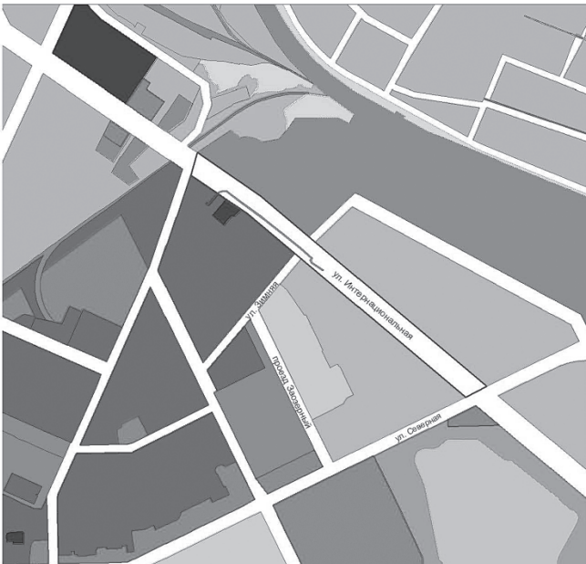
Схема границ проектируемой территории для размещения линейного объекта "Кабельная канализация от существующей ККС 10г-53 до здания по ул. Интернациональной, 24П" в системе улично-дорожной сети города Нижневартовска