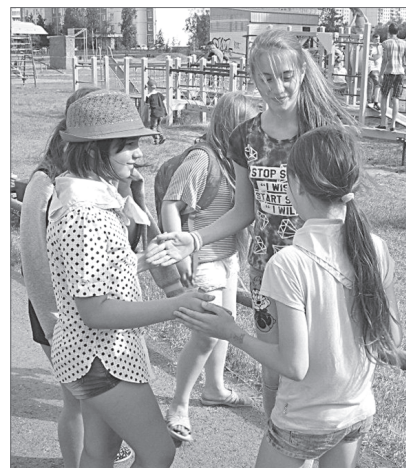
В подростковых клубах организуют мероприятия с учётом интересов ребят от 14 лет.

Подростковые клубы по месту жительства также переориентировали на старшую аудиторию: здесь организуют мероприятия с учётом интересов ребят от 14 лет. Летом в сотрудничестве с некоммерческими организациями проводится открытые фитнес-тренировки (и днём, и вечером) для неорганизованной молодёжи. Основная задача на ближайшую перспективу - привлечь к участию в мероприятиях молодёжь до 18 лет. По мнению экспертов, эта категория наиболее подвержена негативному влиянию, особенно в том случае, если не смогла самореализоваться.