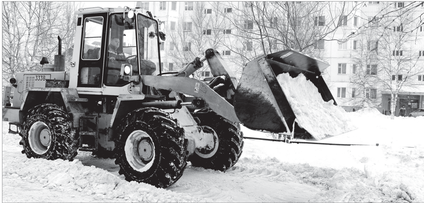
16 мкр: мощному «Амкодору» сугробы не страшны.

Процесс уборки снега наши читатели могли наблюдать в режиме реального времени в группах «Варты» в социальных сетях Facebook, Одноклассники, ВКонтакте, Инстаграм.