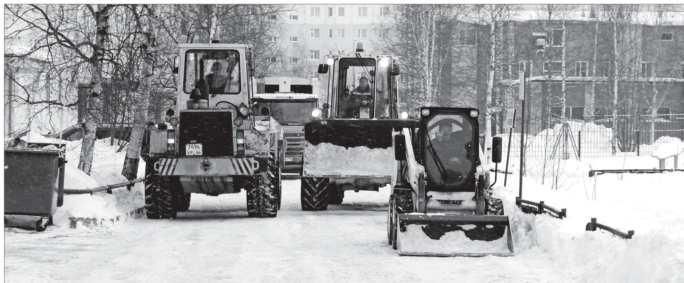
16 мкр: парадом коммунальной техники на борьбу со снегом.