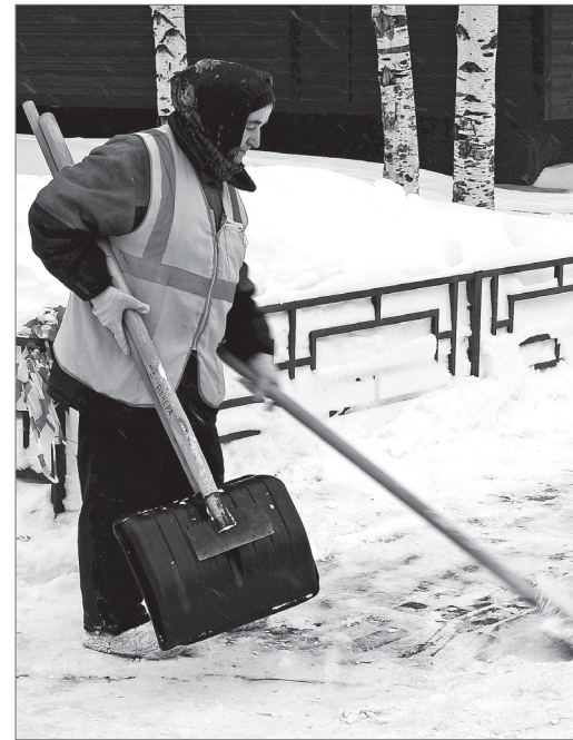
2 мкр: чистим снег до самой брусчатки.