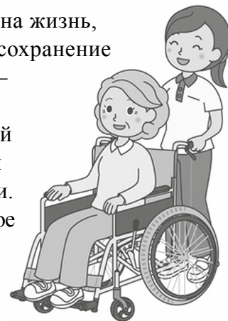
Подготовила Гуля Бессонова.

– Добровольчество – это особый взгляд на жизнь, целое мировоззрение, направленное на сохранение и укрепление человеческих ценностей, – отмечает директор учреждения Светлана Геннадьевна. – Важно, что такой непростой, а порой чрезвычайно сложной деятельностью занимаются молодые люди. Спасибо вам за вашу работу, за неравнодушное отношение, а самое главное – заботу и внимание. Желаем вам здоровья и духовных сил, и пусть ваша деятельность станет ориентиром для современной молодёжи.