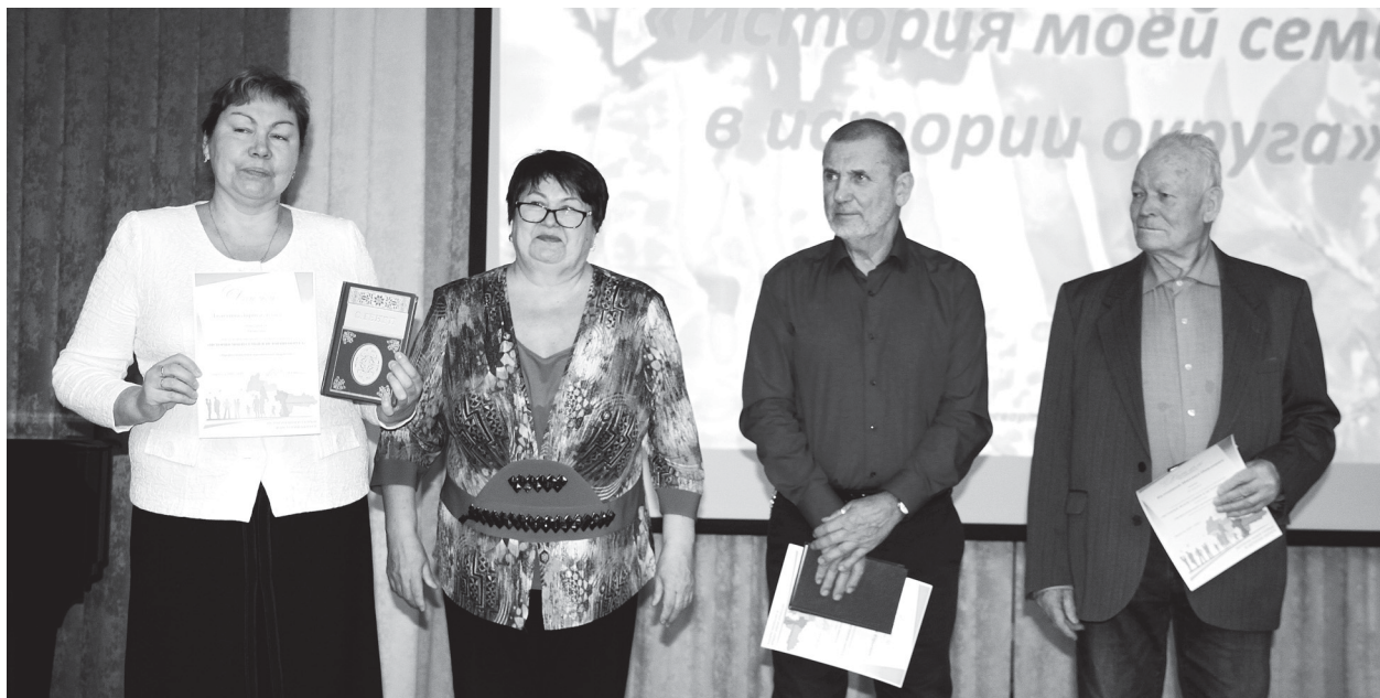
На награждении победителей конкурса в Центральной городской библиотеке им. М.К. Анисимковой.