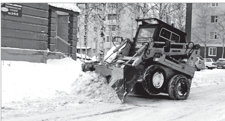
2 мкр: на внутриквартальных проездах полный порядок.