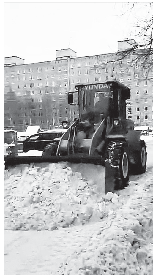
Ул. 60 лет Октября, 5-а: долой снежную кашу!