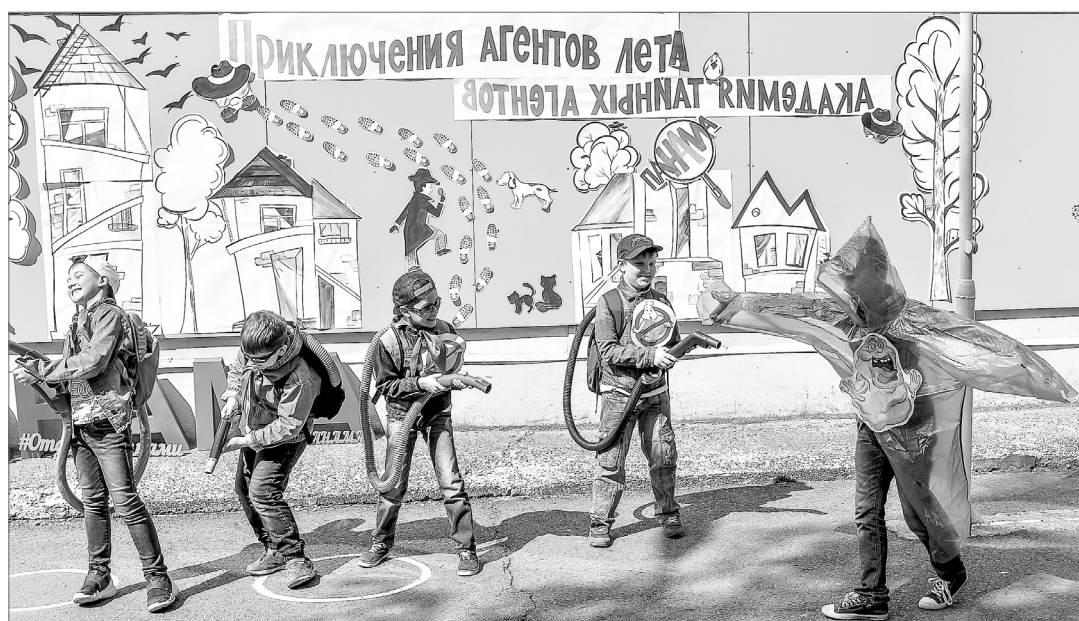
Приведения?! Инопланетяне?! Город может спать спокойно – агенты в панаме не дремлют.

В считанные секунды самые обычные мальчишки и девчонки включаются в процесс игры и начинают жить по заданным правилам. И вот перед нами уже не воспитанники детского лагеря, а разведчики огромной секретной сети – «Панамовская служба безопасности», в состав которой входят шесть отрядов особого назначения: «Колобок», «Дети шпионов», «Ребячий патруль», «Агенты 007», «Шерлоки», «Люди в чёрном».