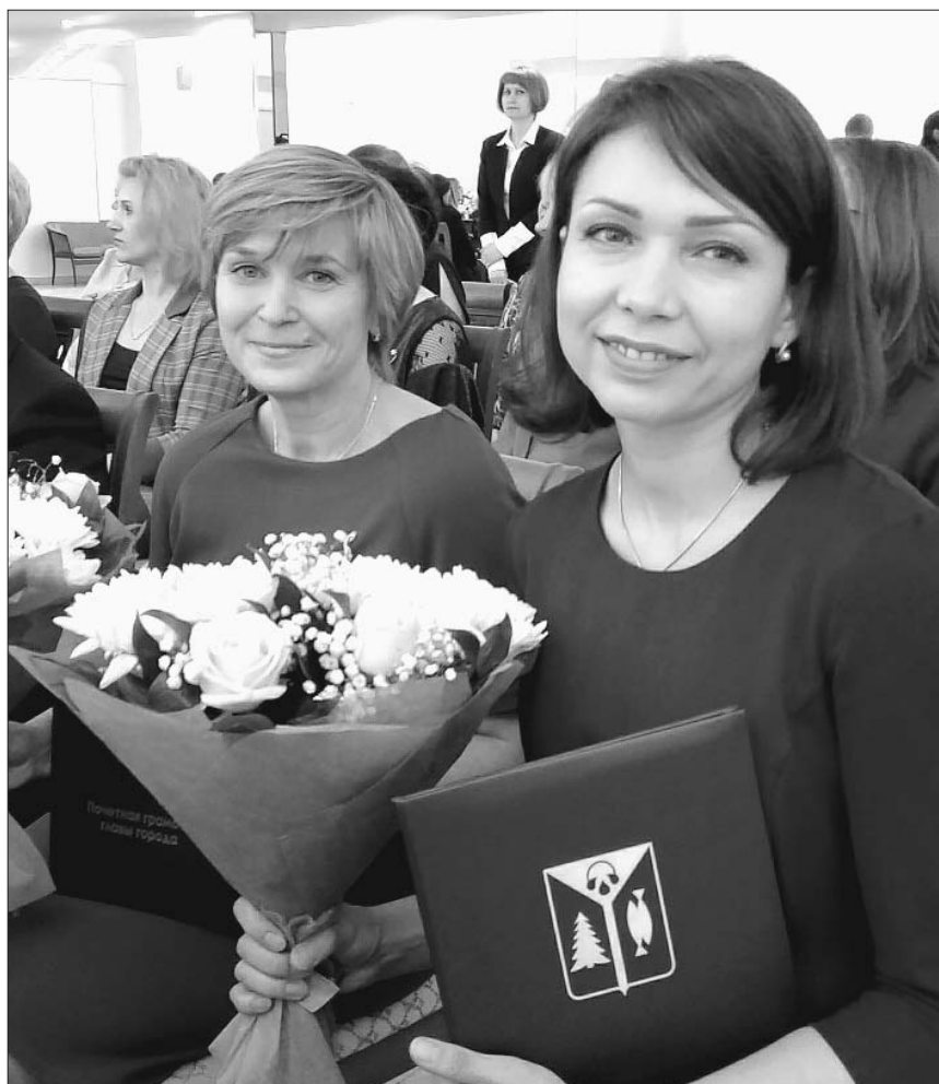
В этот день десятки социальных работников Нижневартовска были отмечены почётными грамотами главы города, благодарственными письмами председателя Думы города и администрации города.

Сердечные, душевные, внимательные, заботливые, добрые. И это всё о них – о социальных работниках. Свой профессиональный праздник они отмечают ежегодно 8 июня. Это праздник людей, которые первыми принимают на себя волны людских проблем и в меру своих возможностей помогают их решать.