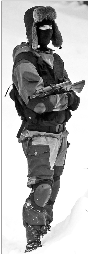
Люди в масках: друзья или враги?

Столичные эксперты, гости из Сургута и Ханты-Мансийска, два дня плодотворной работы и самая большая в округе тематическая площадка по профилактике экстремизма. Антитеррористический форум Югры второй год проводится на базе Нижневартовского государственного университета и по посещаемости бьёт все рекорды. Наряду с полезной информацией, которую студенты могли получить в рамках «круглых столов», у ребят появилась уникальная возможность закрепить свои знания на практике.