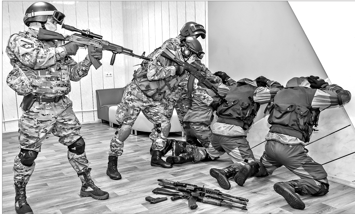
Эксперты убеждены: современную молодёжь нужно учить, как противостоять угрозе терроризма.

Как, проводя огромное количество времени в Сети, не поддаваться внушению со стороны и уметь блокировать враждебную информацию? Почему так важно отличать ложь от правды? Что делать, чтобы не стать очередной жертвой подмены понятий? Тема информационной безопасности назрела давно. Примеры психологического воздействия на неокрепшее сознание нам регулярно демонстрируют с голубых экранов. Значимость проводимой работы по противодействию экстремистским/террористическим проявлениям в молодёжной среде отметили все без исключения эксперты мероприятия.