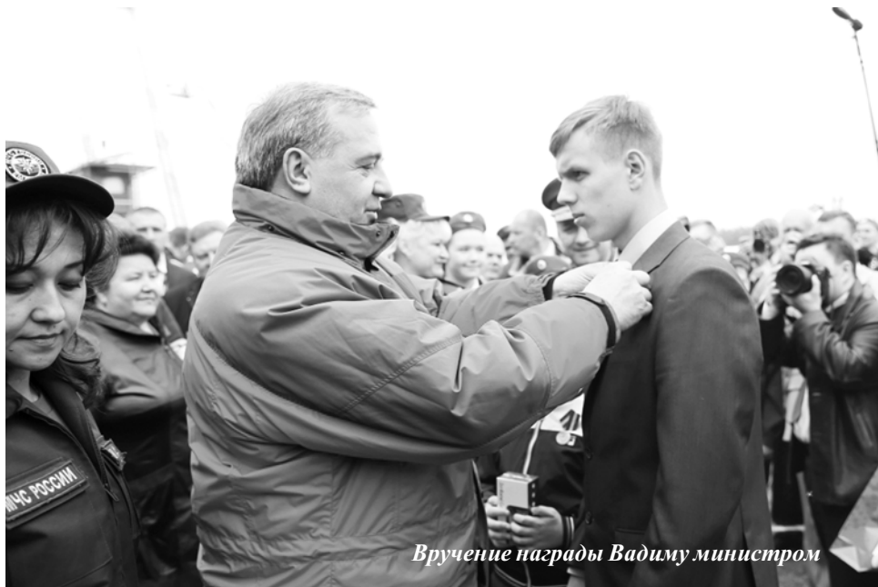
Вручение награды Вадиму министром

17 мая в рамках салона «Комплексная безопасность-2016», который открылся в Ногинском спасательном центре МЧС России, Министр МЧС России Владимир Пучков награждает смоленского школьника медалью «За спасение утопающих».