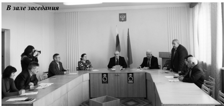
В зале заседания