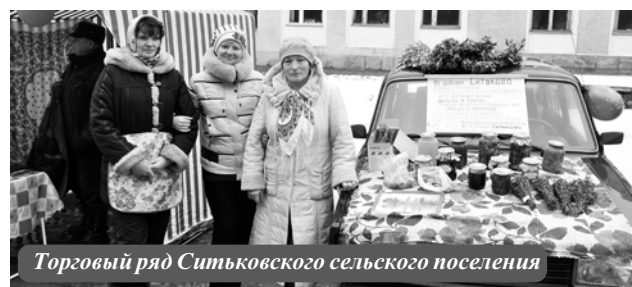
Торговый ряд Ситьковского сельского поселения