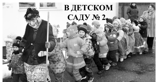
В ДЕТСКОМ САДУ № 2