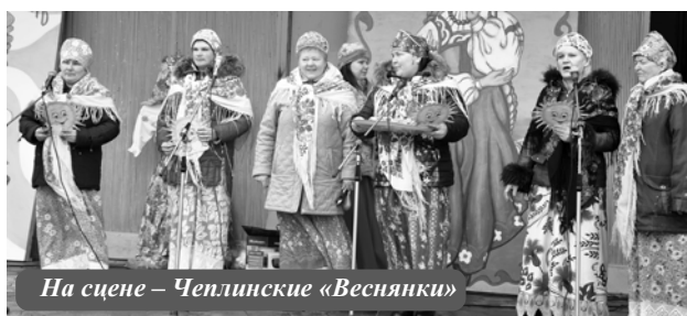
На сцене – Чеплинские «Веснянки»

Г. Валикова Фотоальбом «Зиму проводили – 2015» смотрите на сайте «Велижской нови»