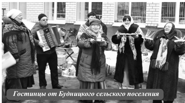
Гостинцы от Будницкого сельского поселения