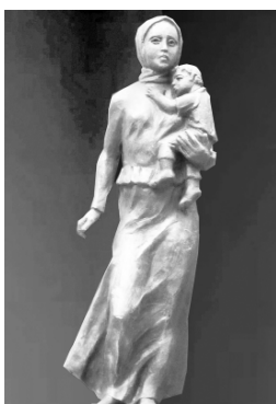
Рабочий проект памятника

На заседании Президиума Ельнинского районного Совета ветеранов войны и труда, Вооруженных Сил и правоохранительных органов по согласованию с общественностью и муниципальными органами власти принято решение о создании и установке в городе Воинской славы Ельне Смоленской области памятника женщине-матери-солдатке-труженице. Аналогичных памятников на территории