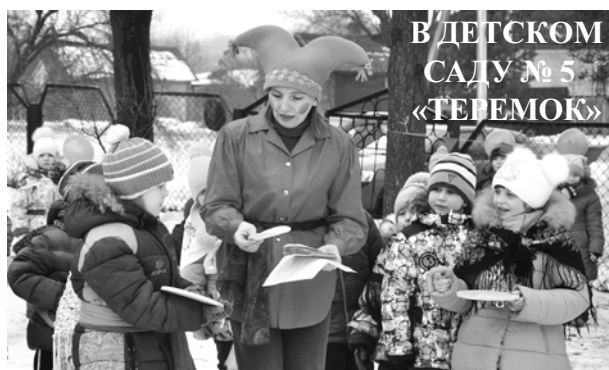
В ДЕТСКОМ САДУ № 5 «ТЕРЕМОК»