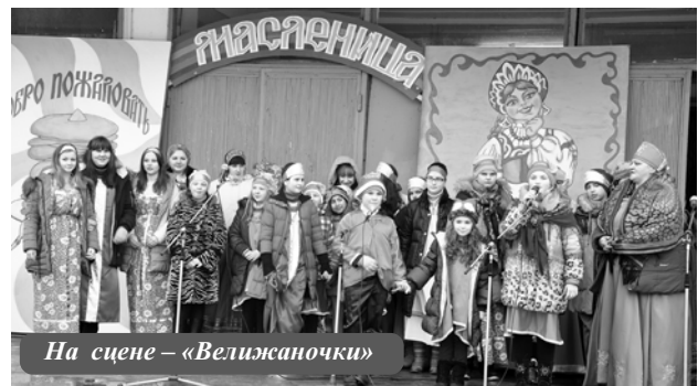
На сцене – «Велижаночки»