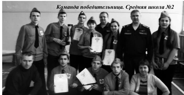
Команда победительница. Средняя школа №2