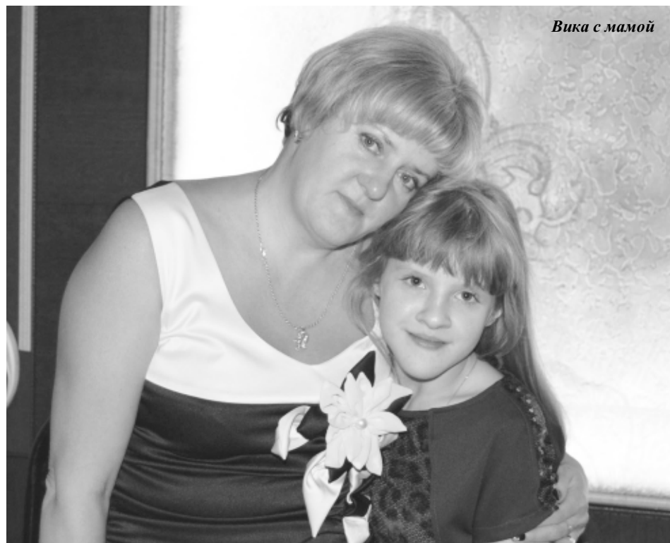
Вика с мамой

Честно скажу, таким количеством грамот, Бла-