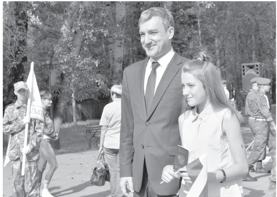
В честь Дня Российского флага губернатор Приамурья В.А.Орлов вручил паспорта юным жителям района