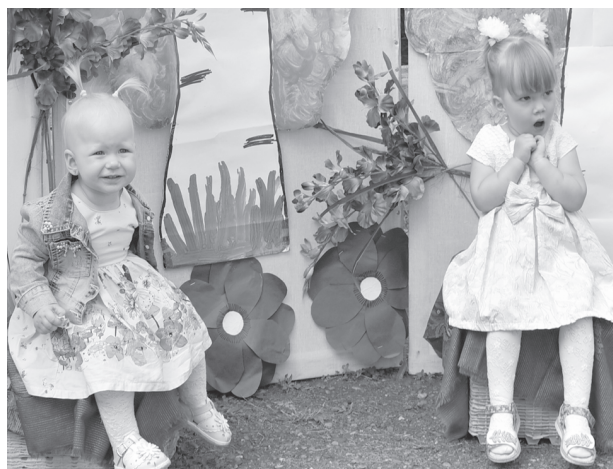
Фотозона для самых маленьких